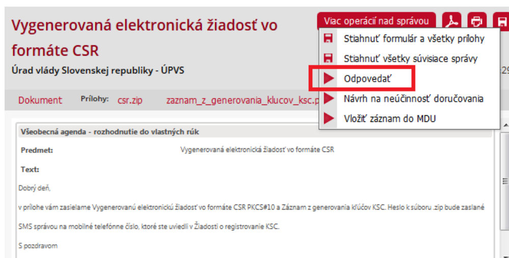
Obr. 6 – Prijatá správa s vygenerovaným CSR

Poznámka: V prípade, že nie ste prihlásení v zastúpení orgánu verejnej moci, vám bude v prvom rade doručená notifikačná doručenka, ktorú je potrebné potvrdiť a až potvrdením doručenky vám bude sprístupnená samotná elektronická správa.