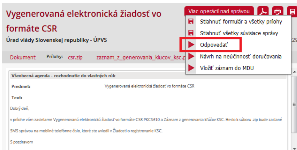
Obr. 6 – Prijatá správa s vygenerovaným CSR

Poznámka: V prípade, že nie ste prihlásení v zastúpení orgánu verejnej moci, vám bude v prvom rade doručená notifikačná doručenka, ktorú je potrebné potvrdiť a až potvrdením doručenky vám bude sprístupnená samotná elektronická správa.