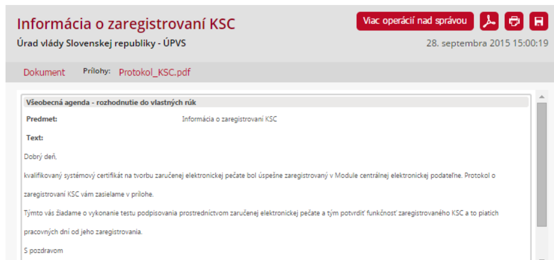
Obr. 7 – Informácia o zaregistrovaní kvalifikovaného certifikátu

Po prijatí správy Úradom vlády Slovenskej republiky - ÚPVS je kvalifikovaný certifikát inicializovaný v Module centrálnej elektronickej podateľne. Informácia o úspešnej inicializácii kvalifikovaného certifikátu vám bude doručená do elektronickej schránky spravidla do 3 až 5 pracovných dní. Prílohou tejto správy je aj Protokol o inicializácii kvalifikovaného certifikátu (Obr. 7).