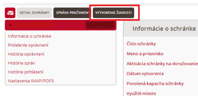
Obr. 2 - Tlačidlo „Vytvorenie žiadosti“

Následne vyberte sekciu „Vytvorenie žiadosti“ (Obr. 2).