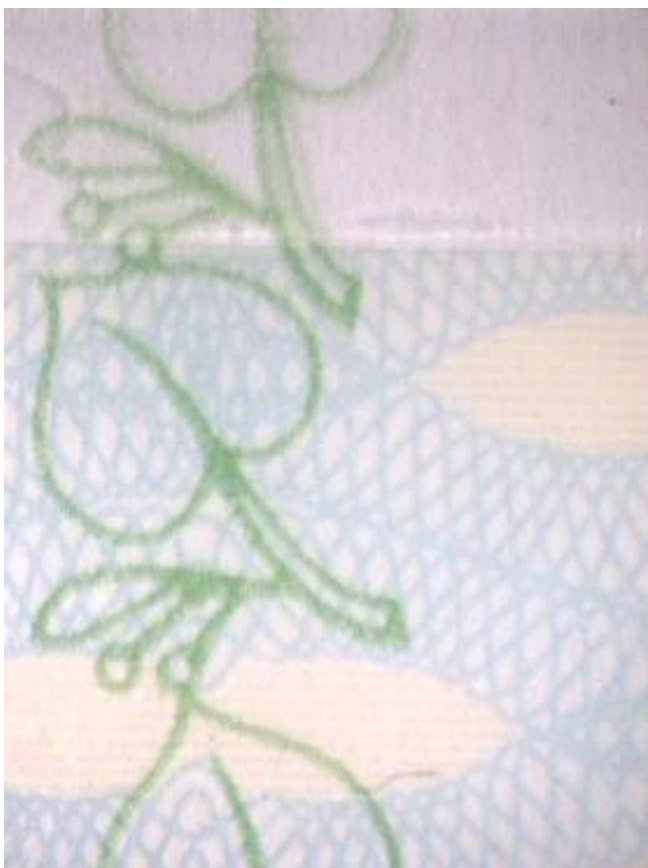
Potlač na fólii vo forme lipových lístkov.