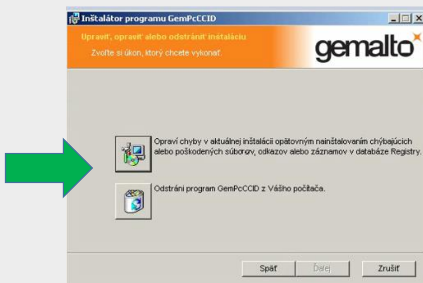
Obr. 4 - duplicita ovládača k čítačke čipových kariet Gemalto

V prípade, ak už používateľ má vo svojom počítači niektorú z aplikácií, najskôr dôjde počas inštalácie k zisteniu duplicity a následne sa poskytne možnosť jej úpravy, opravy alebo odstránenia (Obr. 4 a 5).