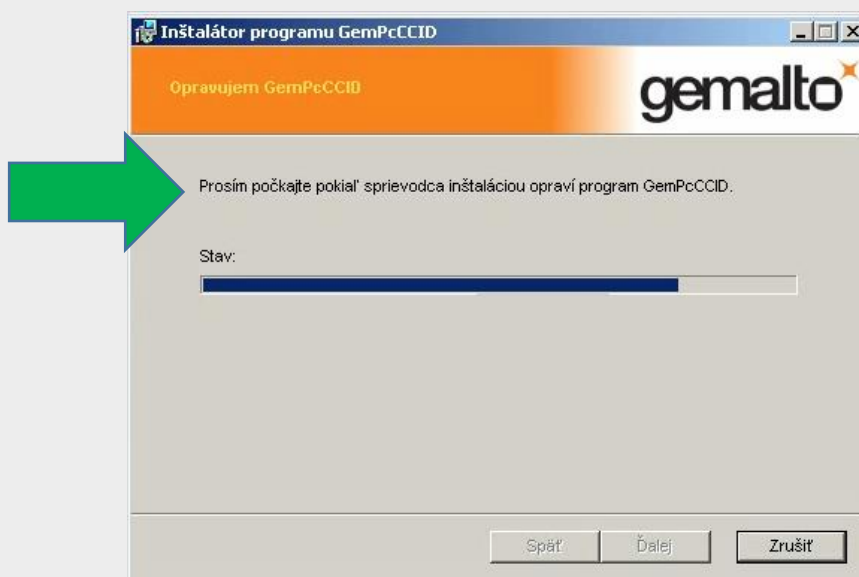
Obr. 5 - oprava programu GemPcCCID.