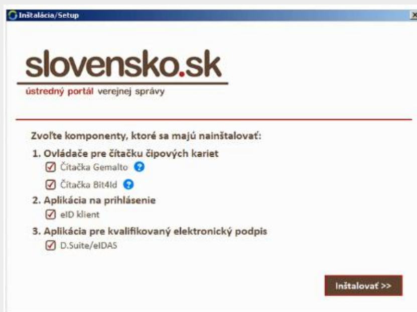
Obr. 1 – obsah inštalačného balíčka aplikácií