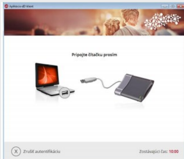
Obr. 2 – Pripojenie čítačky

Ak nemáte pripojenú čítačku čipových kariet zobrazí sa vám okno (Obr. 2), v ktorom budete vyzvaní na jej pripojenie.