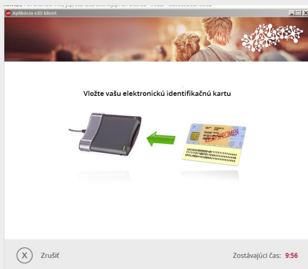
Obr. 3 – Vloženie eID karty

Krok 2 - Následne budete vyzvaní na vloženie eID karty do čítačky čipových kariet (Obr. 3). eID karta je dôveryhodným a bezpečným nosičom identifikačných údajov občana a slúži na preukazovanie totožnosti občana v elektronickej prostredí. Proces overenia identity osoby sa nazýva autentifikácia.