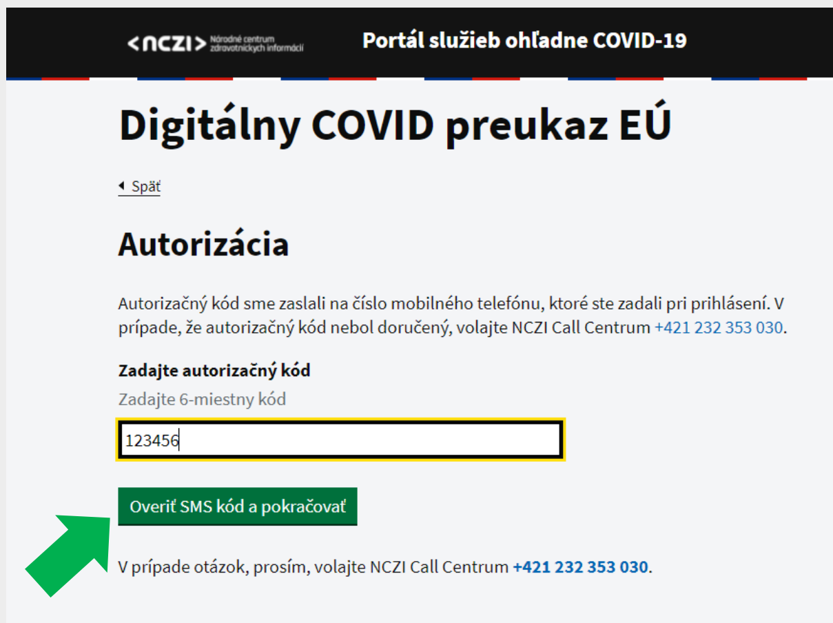
Obr. 6 – Zadanie autorizačného kódu doručeného cez SMS

Krok 6: Na uvedené číslo vášho mobilného telefónu vám do niekoľkých minút cez SMS správu príde 6-miestny autorizačný kód. Zadajte ho do povinného poľa a prejdite na zelené tlačidlo „Overiť SMS kód a pokračovať“ (Obr. 6).