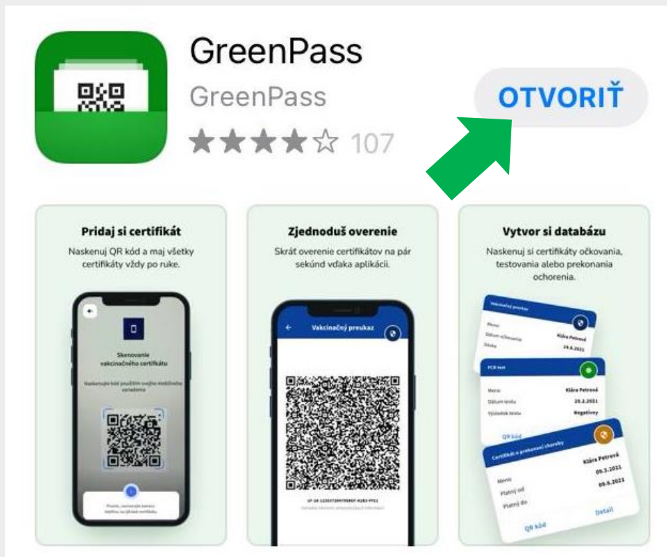
Obr. 10 – Vyhľadanie aplikácie GreenPass priamo v smartfóne

Krok 10: Po stiahnutí aplikácie GreenPass do mobilu vás systém vyzve na jednorazové vytvorenie si 5-miestneho prístupového kódu do aplikácie, prípadne nastavenie odlačku a povolenie prístupu fotoaparátu pre účely načítania QR kódu.