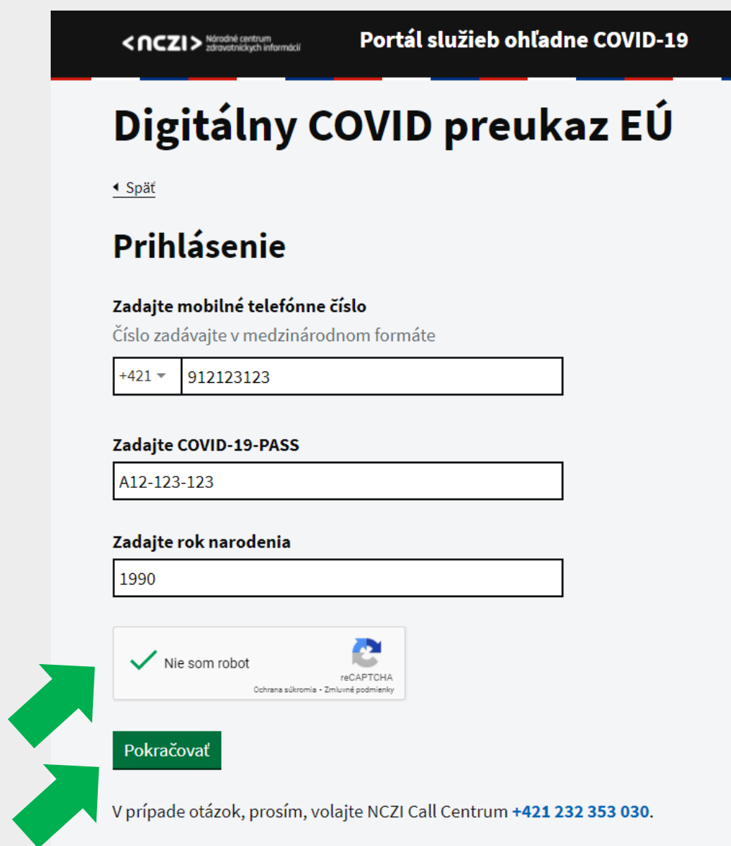
Obr. 5 – Vyplnenie formulára

9-miestny COVID-2019-PASS si uschovajte!