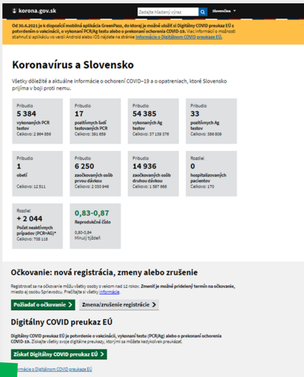
Obr. 1 – Tlačidlo k získaniu Digitálneho COVID preukazu

Krok 1: Na stránke korona.gov.sk prejdite na zelené tlačidlo „ Získať Digitálny COVID preukaz EÚ “ (Obr. 1).