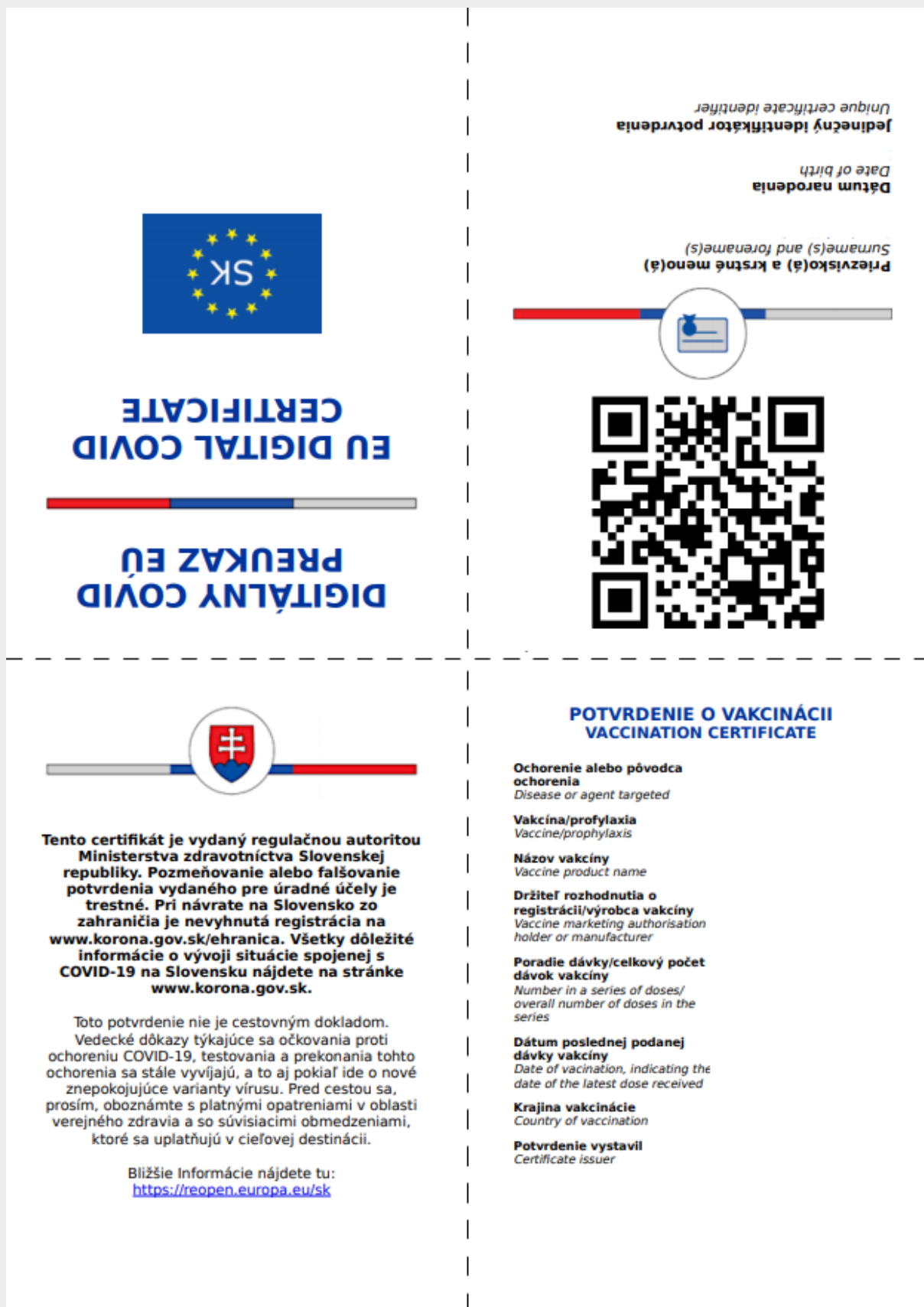
Obr. 9 – Váš Digitálny COVID preukaz EÚ obsahuje jedinečný QR kód

Vypracoval: Odbor informačného obsahu ÚPVŠ, Národná agentúra pre sieťové a elektronické služby Pozn.: Použité obrázky sú len ilustračné.