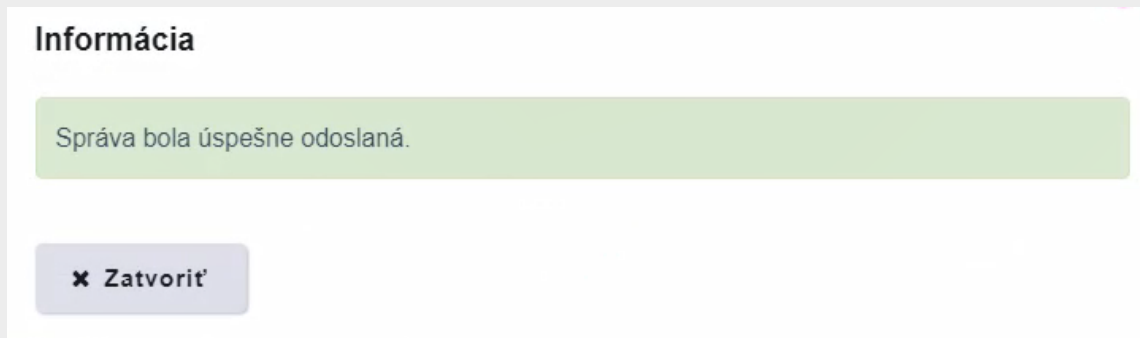
Obr. 9 – Potvrdzujúca informácia

Krok 9 – Následne do prijatých správ obdržíte správu potvrdzujúcu udelenie oprávnenia (Obr. 10).